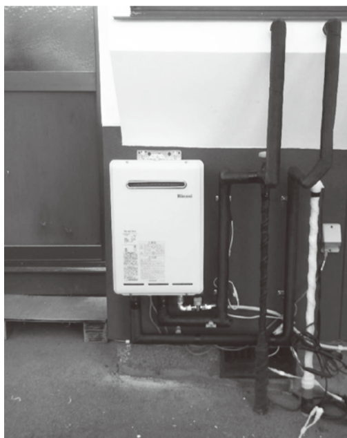
①お勝手のすぐそばに取付けたガス給湯器