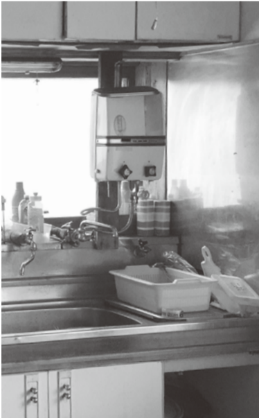
②目の前の障害物 瞬間湯沸かし器

そこで国実が考えた。お勝手の前にボイラーをつけます！写真①のようにガスボイラーを設置します。このお宅の場合で以前の3分の1の時間で、お湯が出るようになりました。