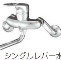
シングルレバー水栓

お申し込みは、官製はがきに住所・氏名・年齢・電話番号を明記のうえ、〒385・0005 1 佐久市中込3611-170 国実【省エネレスキュー普及拡大推進品】プレゼント係まで。締め切りは12月10日まで。