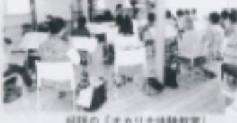
好評の「オカリナ体験教室」