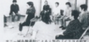
ヤニー鍼灸整骨院による人気の「イスロが教室」