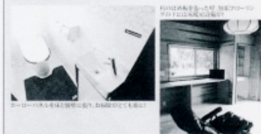
右：LED照明、防音、防湿、防カビ、防臭、防虫、防ダニ、防アレルギー、防花粉、防PM2.5、防PM10、防PM2.5+10、防PM2.5+10+PM10、防PM2.5+10+PM10+PM10

直すことが健康長寿社会への備えとされています。100才人生、考えれば風の強くなるような話でもリフォームする、しないに関係なく、まずは10年後の自分を想像してみてください。その時自分を暖かく包み込んでくれるのは、5つの環境要素を備えた住環境だと思えます。まずは計画から、お気軽にご相談下さい。