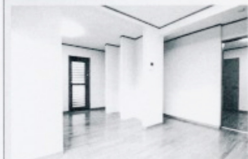
右：LED照明、防音、防湿、防カビ、防臭、防虫、防ダニ、防アレルギー、防花粉、防PM2.5、防PM10、防PM2.5+10、防PM2.5+10+PM10、防PM2.5+10+PM10+PM10