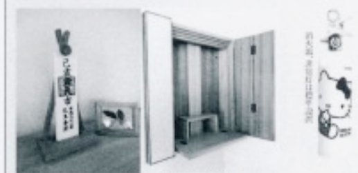
左：R.C. 風光、日照対策、LED照明、防音、防湿、防カビ、防臭、防虫、防ダニ、防アレルギー、防花粉、防PM2.5、防PM10、防PM2.5+10、防PM2.5+10+PM10、防PM2.5+10+PM10+PM10