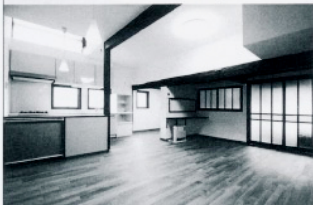
左：R.C. 風光、日照対策・バラス、LED照明、防音、防湿、防カビ、防臭、防虫、防ダニ、防アレルギー、防花粉、防PM2.5、防PM10、防PM2.5+10、防PM2.5+10+PM10、防PM2.5+10+PM10+PM10